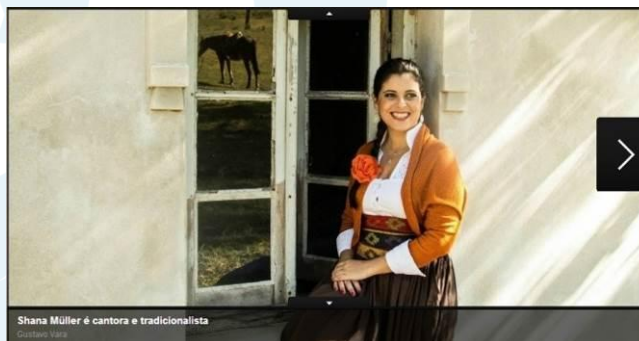
Figura 1: Ensaio fotográfico da apresentadora antes de assumir o programa

Na figura 1, a apresentadora usa camisa com decote e detalhe em broderie que enfatizam a feminilidade, assim como a faixa que marca a sua cintura com formas geométricas que sugerem o grafismo próprio da região missioneira do Rio Grande do Sul. A peça sobre a camisa sugere a produção artesanal em lã. A trança no cabelo, arrematada com a flor e a saia longa remetem à mulher rural do século XIX no Rio Grande do Sul. O brinco circular sugere o formato do broche usado pelas estancieiras também durante o século XIX.