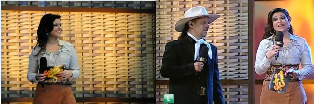
Figura 4: Vestuário e adornos da apresentadora Shana Muller

representações do discurso identitário regional feminino, expresso por sua vestimenta e utilização de adornos.